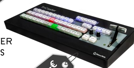
TRICASTER Mini-CS (option)